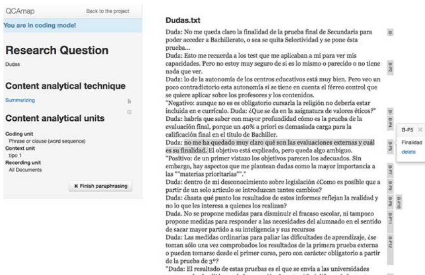
Imagen 2. Utilización de QCAMap para el análisis cualitativo de etiquetas para la identificación de contenidos principales y la definición de subcategorías